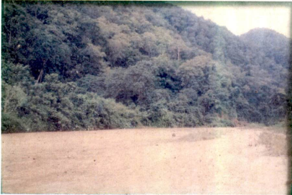
รูปภาพเส้นทางด่านพรมแดนบ้านเสาทิน